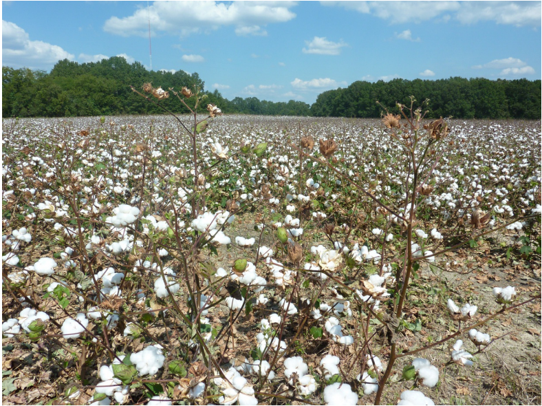
De katoen staat in bloei in de Mississippi Delta

De staat Mississippi is genoemd naar de Mighty Mississippi, de rivier die de westgrens van de staat vormt. En daarmee is meteen een deel van het zo kenmerkende landschap van de staat verklaard: de rivierdelta die het westelijke deel van Mississippi tekent. En zo'n belangrijke rol speelt in de geschiedenis van Mississippi: een vruchtbare bodem met uitgestrekte katoenvelden, bewerkt door uit Afrika geïmporteerde tot slaaf gemaakten. De geboortegrond van de blues en het decor van de strijd voor burgerrechten.