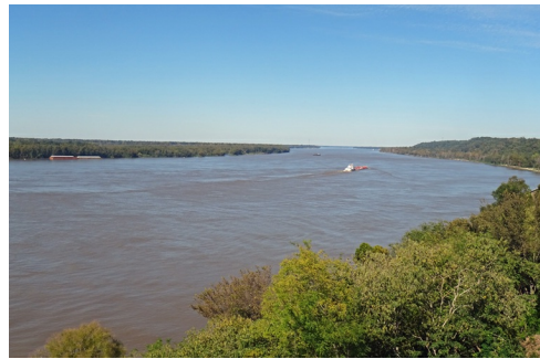
De Mississippi bij Natchez

anen werd de rivier een belangrijke handelsweg. Vanaf de 19de eeuw vervoerden stoomboten landbouw- en industrieproducten over de rivier. Het veroveren van de controle op de Mississippi door de Noordelijke troepen was een beslissend keerpunt in de burgeroorlog. In de loop van de 20ste eeuw werd met de bouw van dijken, dammen en sluizen de rivier steeds meer een door de mens gecontroleerde vaarweg. Maar de elementen konden niet altijd worden bedwongen. In 1927 vond de Great Mississippi Flood plaats, de grootste rivieroverstroming ooit in de VS. Vooral de Delta was de dupe. 70.000 km 2 kwam onder water te staan, 700.000 mensen, meest Afro-Amerikanen werden dakloos en vijfhonderd mensen verdronken. Na de ramp legde men meer dijken, sluisen en dammen aan, maar tot op de dag van vandaag zijn er regelmatig overstromingen. De landbouw is de grootste vervuiler van de rivier. De talloze plantages en boerderijen langs de rivier maken de aanpak van de vervuiling 'vanaf de bron' moeilijk. De rivier is onderwerp van veel boeken en liederen. De overstroming van 1927 is