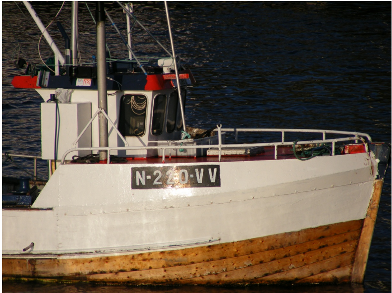
Typische vissersboot waarmee sinds jaar en dag kabeljauw wordt buitgemaakt

Helemaal in het noordoosten van de Lofoten ligt het eiland Austvågøy. In het noorden paalt het eiland aan de archipel Vesterålen en in het oosten wordt het door de zee-engte Raftsund geflankeerd. Dankzij de in december 2007 geopende wegverbinding (Lofast) is Austvågøy zonder veerboot bereikbaar. Een indrukwekkend berglandschap beslaat het grootste deel van het eiland, rond de Raftsund vinden we zelfs een aantal duizenders. De hoogste piek, de Higravtinden, is met zijn 1146 meter meteen ook het dak van de Lofoten. Op Austvågøy ligt ook de grootste stad van de Lofoten, Svolvær, een levendige haven die dagelijks met een bezoekje van het Noorse passagiersschip Hurtigruten wordt vereerd.