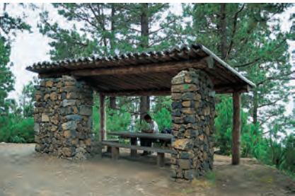
Schuilhutje (Choza) in het dal van Orotava

en natuurlijk de bananen, een van de belangrijkste economische goederen van het eiland. Dit door de staat en de EU gesubsidieerde landbouwgewas groeit in de kuststreken tot op circa 300 m hoogte en heeft zeer veel water nodig. Circa 20% van het eiland is met bos bedekt: Het dichte, oerwoudachtige laurierbos (nevelwoud) is op enkele restbestanden in het Anaga- en in het Teno-gebergte na vrijwel verdwenen – het groeit voornamelijk op de vochtige noord- en oosthellingen en kloven. Boven het laurierbos volgt de Fayal-Brezal-zone