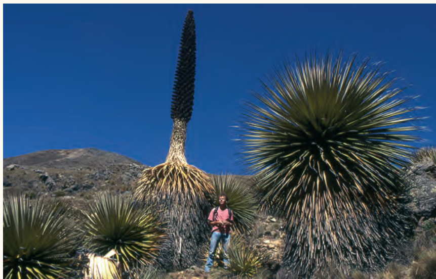
Reuzenbromelia's in de Cordillera Blanca

De meest verbreide hooggebergtevegetatie in Peru is de puna die ontstaat in gebieden met weinig neerslag. Punavegetaties dragen duidelijke sporen van het vijandige klimaat en bestaan uit grassen, (korst)mossen en een klein aantal kruiden en struiken. Harde, taaie en scherpe grassen zijn de talrijkste planten van de puna. De dode sprietten vormen stekelige gele pollen die als bescherming dienen voor de jonge groene loten binnenin. Door veel hooglandindianen wordt aan het einde van de droge tijd de puna in brand gestoken. Het doel hiervan is de stekelige en oneetbare graspollen te vernietigen zodat jonge, voor vee eetbare grassen en kruiden een kans krijgen. Niet algemeen maar wel karakteristiek zijn yaretas . Dit zijn mossen die zeer dicht opeen groeien in bolvormige structuren. Zo slagen de individuele plantjes erin de invloed van kou en droogte tot een minimum te beperken. Azorella-kussens bevatten veel hars wat hen, in gedroogde vorm, tot een geschikte brandstof maakt. Ze worden hierom door de lokale bevolking geoogst en zijn zeldzaam gewor-