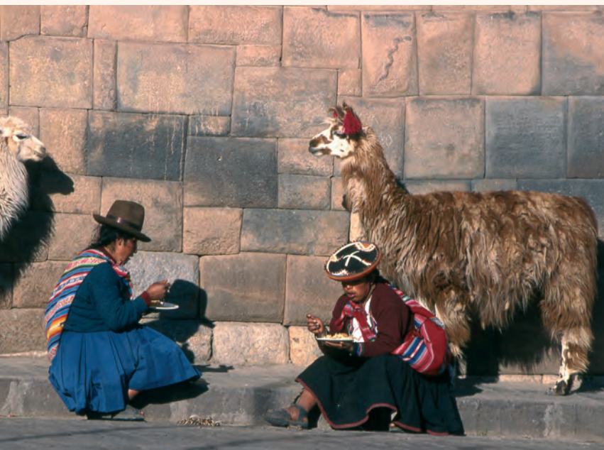
Straatbeeld in Cusco

Naast de ongeëvenaarde constructie waren veel gebouwen – met als voornaamste voorbeeld Coricancha – rijk gedecoreerd. De Spaanse kroniekschrijver Pedro de Cieza de León schreef over Coricancha dat de muren en poorten waren versierd met platen van goud. Verder was er een gouden afbeelding van de zon, de punchau. Deze was groter dan een mens, kunstzinnig bewerkt en ingelegd met edelstenen. Uit de uit goudklompjes bestaande aarde van de tuin rezen maïsplantjes op van hetzelfde metaal.