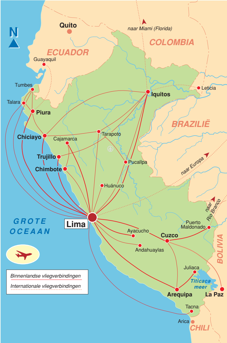
VLEGVELDEN EN VLEGVERBINDINGEN

Tickets voor binnenlandse vluchten konden meestal nog de dag voor vertrek worden gekocht, maar het failliet gaan van Aerocontinente heeft het aanbod van vluchten wel minder gemaakt. Ook in de weekends en rond feestdagen kun-