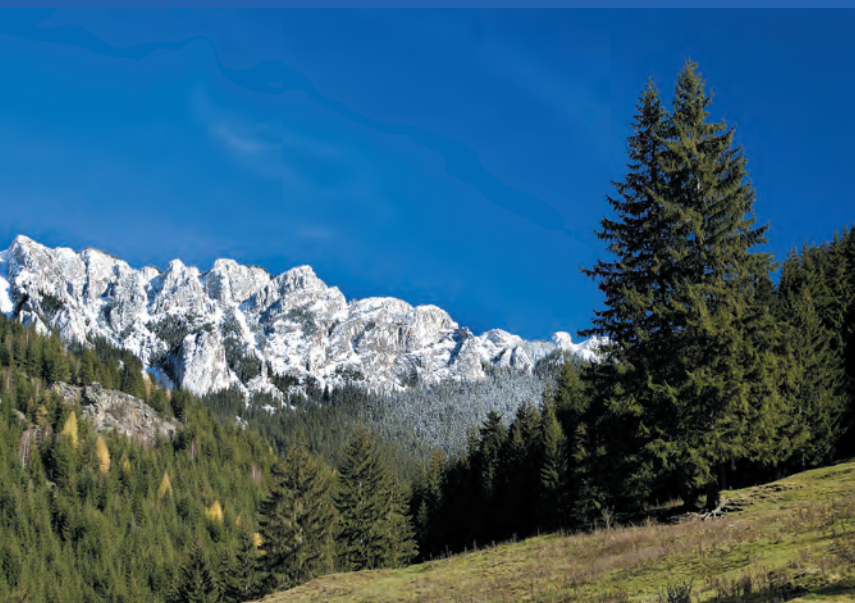
De Hășmaș bergen bij Gheorgheni