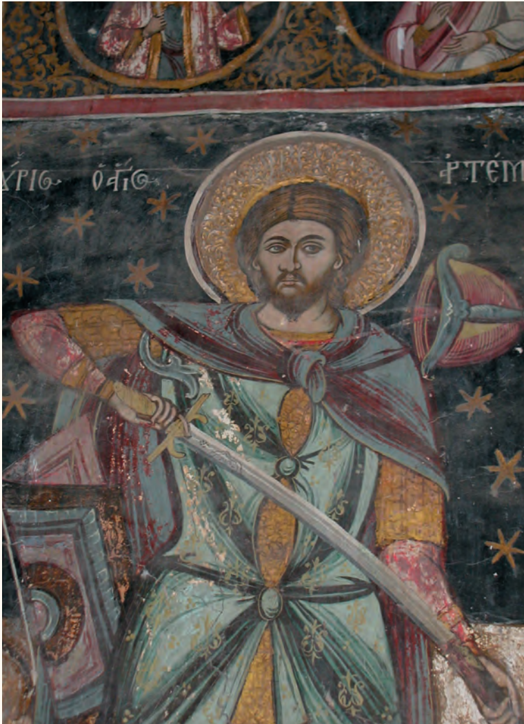
Fresco's in de hofkerk van Targoviște

zaam maar zeker steeds verder zuidelijk teruggedrongen. Boedapest werd niet veel later ontzet en de nieuwe heren van Transsylvanië werden de Habsburgers. Een tijdlang probeerden de Turken met politieke middelen hun invloed in Moldavië en Walachije te behouden: gouverneurs van Griekse origine (Pathanen) werden aangesteld, wat in deze contreien in veel opzichten een liberaler sociaal-economische koers tot gevolg had dan in het Habsburgse Rijk. Zo werd in Moldavië en Walachije het lijfheerschap al in 1749 afgeschaft, 36 jaar eerder dan in Transsylvanië.