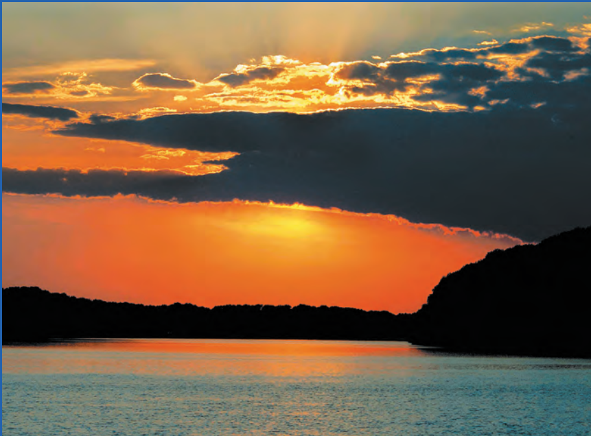
Bij de Donaudelta