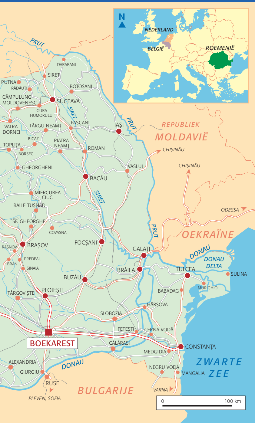
ROEMENIË, OVERZICHT EN LIGGING IN EUROPA