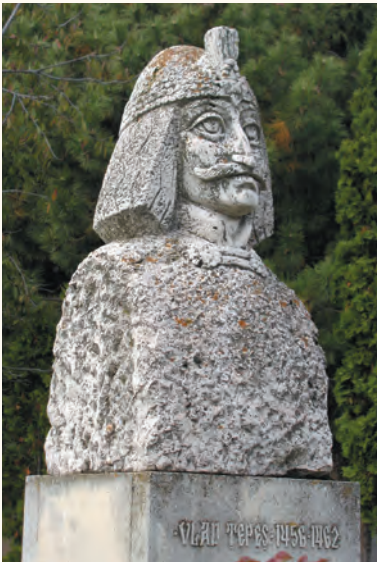
Vlad Țepeș heeft meer gedaan dan alleen maar model staan voor graaf Dracula

Na de verwoestende inval van de Mongolen onder Dzijngis Khan (in 1241) werden door koning Béla van Hongarije vele immigranten uitgenodigd om zijn rijk te komen versterken. Hieronder bevonden zich talloze Saksische boeren, mijnwerkers en ambachtslieden die de ontwikkeling van Hongarije en Transsylvanië een hoge vlucht verleenden. In deze samenleving waren zowel Hongaren, Székely als de Saksen vertegenwoordigd in de Diet, het adviesorgaan voor de regent van Transsylvanië. De Walachijers daarentegen hingen het orthodoxe geloof aan en werden zwaar gediscrimineerd. In Maramureş kwam het tot de opstand van Bogdan Vodă, die in 1359 over de Karpaten trok om in Moldavië een nieuw prinsdom te stichten. Moldavië en Walachije waren niet geheel zelfstandig en schatplichtig aan het Hongaarse Rijk, maar zochten al snel samenwerking met elkaar vanwege de gemeenschappelijke wortels en vijanden. Belangrijke personen in deze eerste pogingen tot integratie waren Negru Vodă (Zwarte Prins) en zijn zoon Radu Negru of Basarab I, koning van Walachije van 1310-1352. Daarna kreeg de regio te maken met nieuwe buitenlandse mogendheden: Moldavië kwam geleidelijk onder de invloedssfeer van Litouwen te liggen terwijl Walachije schatplichtig werd aan het Turkse Rijk.