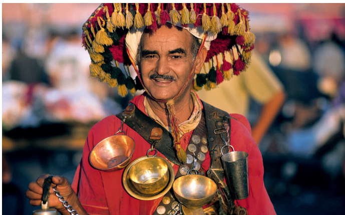
De waterverkopers in Marrakech zorgen voor de noodzakelijke verfrissing

talrijk. Ze zijn te herkennen aan een groen knipperend neonkruis. Nacht- en weekenddiensten horen bij de ingang te zijn vermeld.