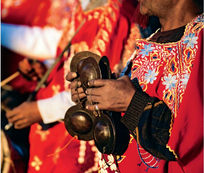
Garagabs, instrumenten in de Gnaoua-muziek

Mawlid an-Nabi: de geboortedag van de profeet Mohammed. Komende data zijn 22 december 2015 en 12 december 2016.