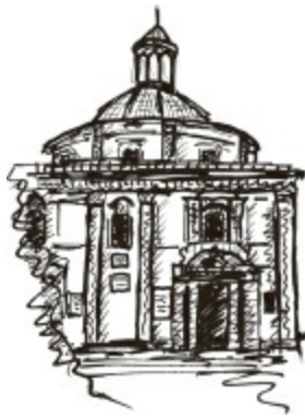
Basilica de la Virgen de los Desamparados

verkeersdrukte maar vol levenslust: ambtenaren in dienst van de regering van de autonome regio Valencia lopen gehaast van de ene afdeling naar de andere, gelovigen gaan met neergeslagen ogen de basiliek binnen en kinderen spelen rond de fontein en jagen de duiven op. 's Avonds oefenen skateboardende jongeren hun kunststukjes op het marmeren plaveisel van het plein en treffen de inwoners van de stad elkaar voor een uitgaansavondje in de Barrio del Carmen. Niet voor niets komen hier in de weekends van met name het voor- en najaar veel huwelijksfotografen en bruidsparen: de basiliek en de Turiafontein vormen samen met de magische sfeer de ideale omgeving voor de jonggehuwden om het trouwalbum van fraaie plaatjes te voorzien. Toeristen genieten vooral van de cafés en terrassen, nemen een slok en laten de sfeer op zich inwerken. Ik ben er zeker van dat het mediterrane tempo ook jou zal bevallen. Pas als je je daaraan overgeeft, ben je echt in Valencia aangekomen.