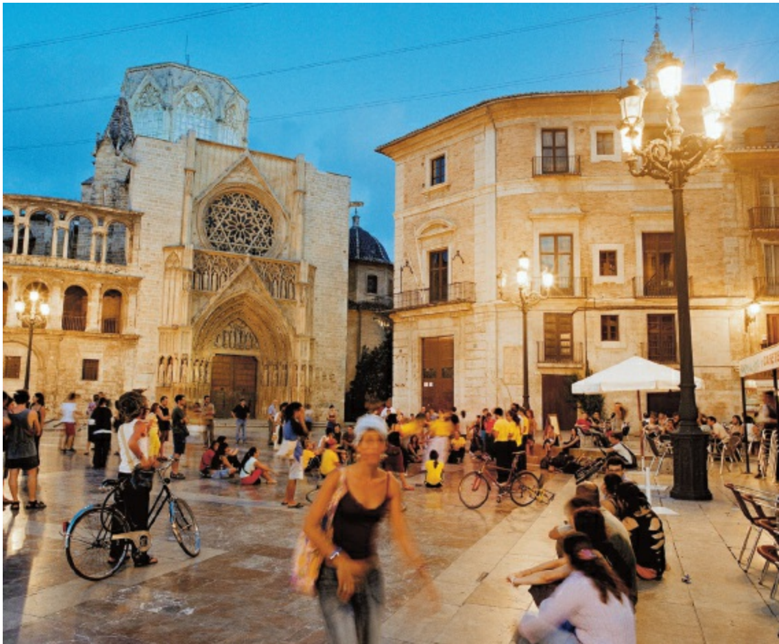
Marmer en magie: het plein van de schutpatrones van Valencia.

Als de zon ondergaat en de straatlantaarns het 'Plein van de Maagd' in een warm licht zetten, ontdek je de bijzondere sfeer en de magie van deze plek. De Valenciano's houden van het plein omdat geschiedenis, hartstocht en een mediterraan levensgevoel er samenkomen.