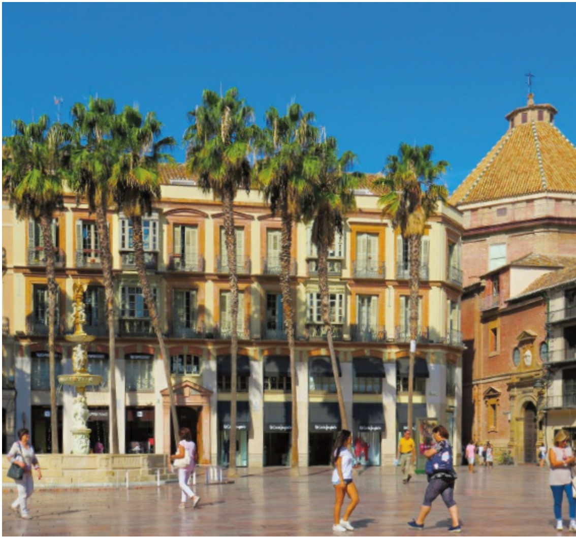
Plaza de la Constitución