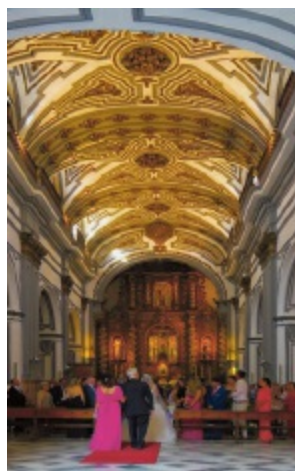
Een huwelijk in de Iglesia de San Juan Bautista.

Tot 1999 was de San Juan aan de buitenzijde wit gepleisterd, maar bij werkzaamheden werd ontdekt dat daaronder geometrische patronen in okergeel, rood en grijsblauw schuilgingen. Onderzoek toonde aan dat deze decoratie in 1732 werd aangebracht.