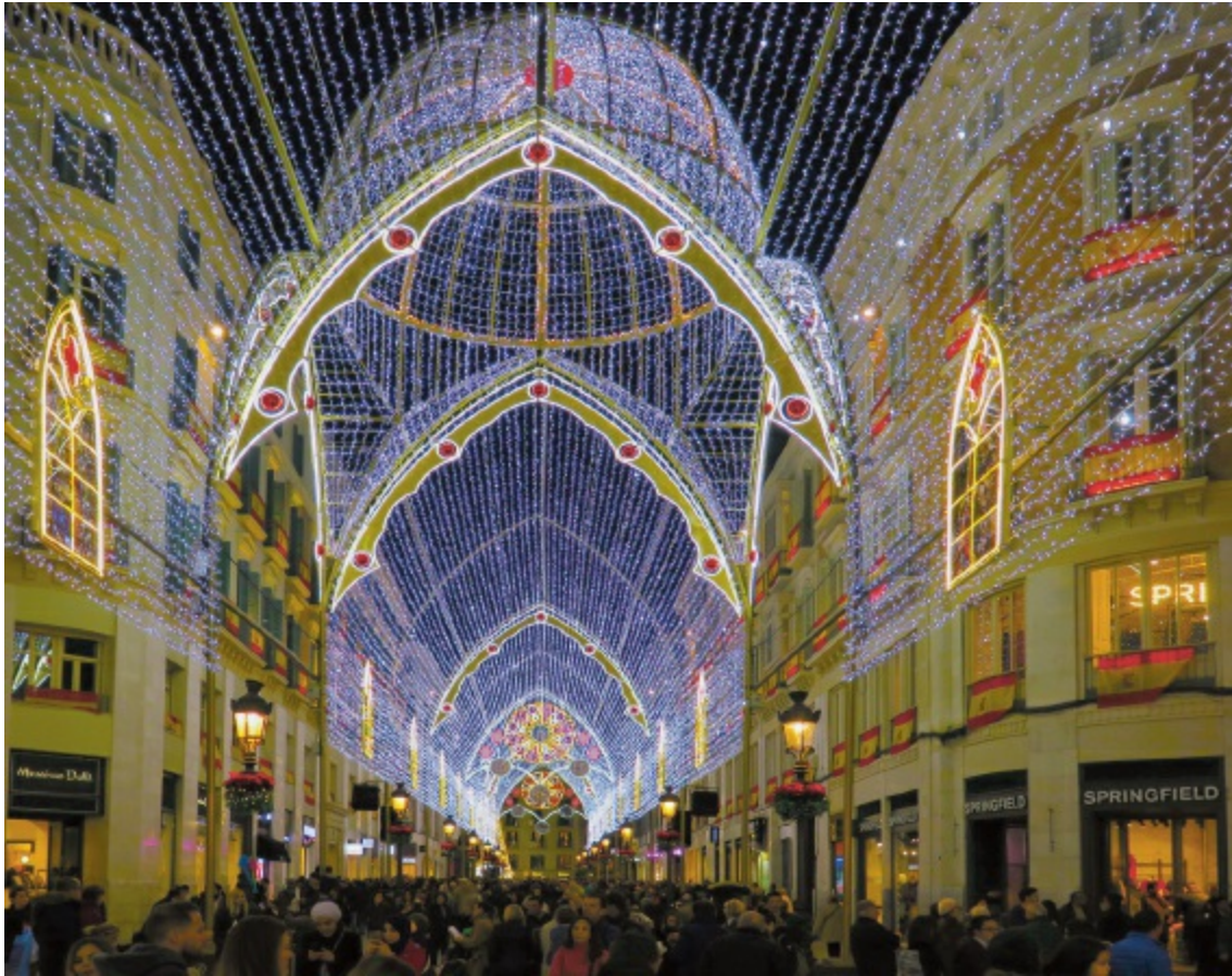
Calle Larios in kersttijd.