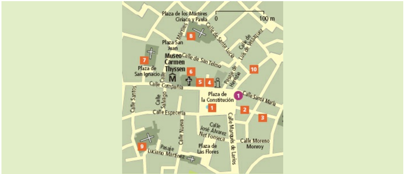
Uitneembare kaart: kaart 2, E-F 4-5 | Bus 1, 3, 11, 14, 37, C1, N1