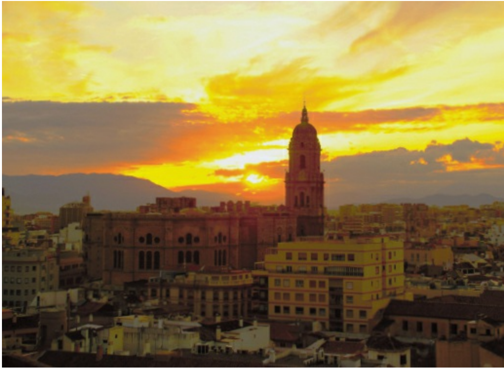
De kathedraal van Málaga.