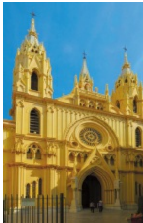
Iglesia del Sagrada Corazón.