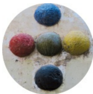
De intrigerende ballen op de San Juan Bautista.

Vijf mysterieuze ballen ( cinco bolas ) versieren de muur van de San Juan Bautista op de hoek met de straat die naar dit vijftal is genoemd, de Calle Cinco Bolas. Over hun betekenis doen verschillende verhalen de ronde. Stellen ze kanonskogels voor die de strijd tegen de Moren symboliseren? Of zijn het de vier elementen (aarde, lucht, water, vuur) met in hun midden een groene bal voor het geloof? Maar er is ook nog een derde verklaring. Naast de kerk was ooit een nonnenklooster met een geheime deur die toegang gaf tot een bordeel. De ballen zouden de mannen de weg hebben gewezen naar hun heimelijke plezier.